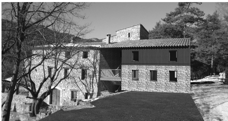
Vue identique avec l'extension prévue ainsi que l'escalier de secours