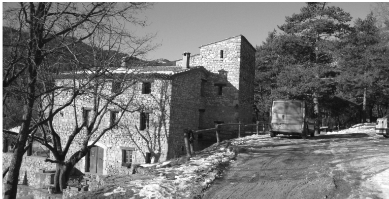
Vue côté Est où se construira l'extension du bâtiment

sages paysans d'autrefois qui, afin de ne pas fragiliser leur gestion, ne dépensaient que ce qu'ils avaient. Merci aussi à vous qui nous avez déjà aidé et qui continuez afin de permettre de terminer ce projet.